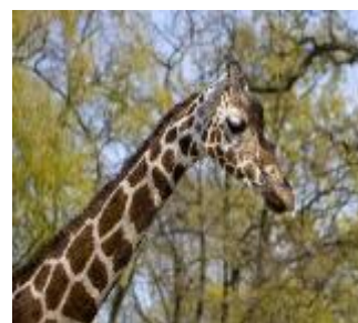
Berliner Zoo – ältester Zoo Deutschlands