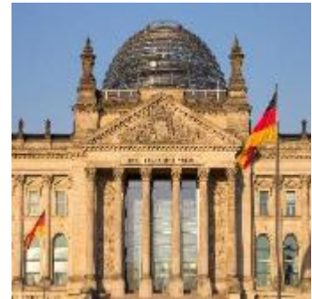
Reichstag – politisches Zentrum Deutschlands; offen für Besucher