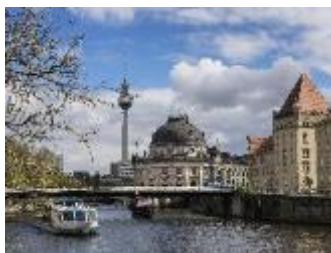
Museumsinsel – Kultur pur! Vier große Museen und Galerien