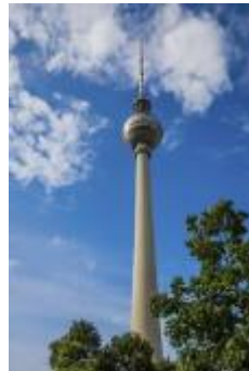
Fernsehturm – höchstes Gebäude Deutschlands; Berlin von oben sehen