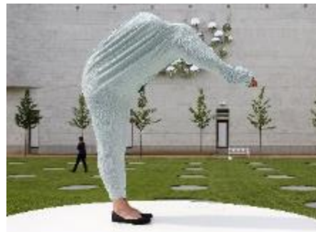
2012: moderner, unterirdischer Erweiterungsbau