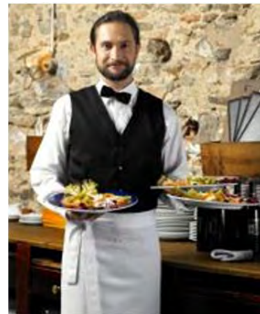
El sector de los servicios

Fuente: Instituto Nacional de Estadística (INE) enero de 2013