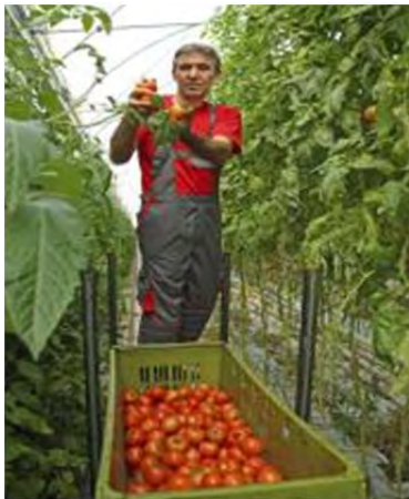
El sector agrícola

En 2013 había 5,5 millones de extranjeros en España, el 11,70% de la población total.