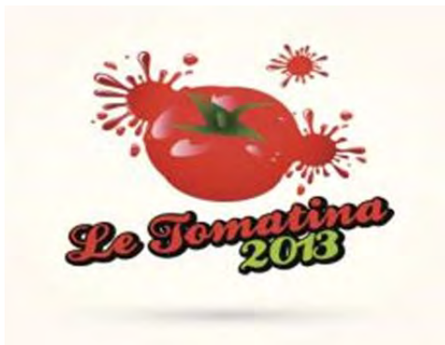
Una fiesta de agosto

La ciutat de València compta el 2009 amb un total de 814.208 habitants, segons dades de l' INE .