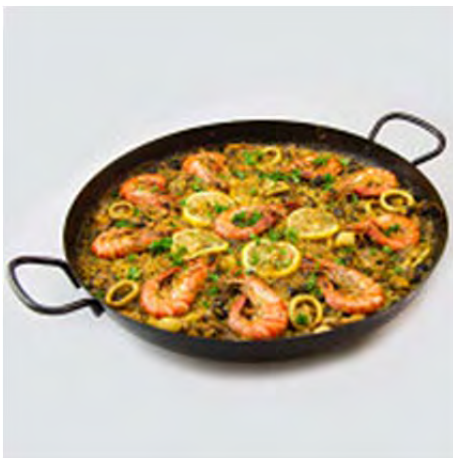
La paella valenciana