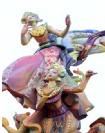
Las Fallas y el nit del foc